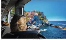
Les voyages en autocars : quel succès !

PÉNURIE DE CHAUFFEURS Malheureusement, le secteur, suite à toutes ces demandes, a énormément de mal à trouver des chauffeurs.