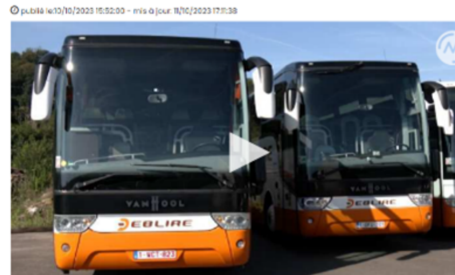
Les sociétés d'autocars attendaient avec impatience l'autorisation d'engager du personnel avec le statut de "flexi-job"

Voir: la société Deblire applaudit l'autorisation de recourir aux flexi-jobs pour son secteur