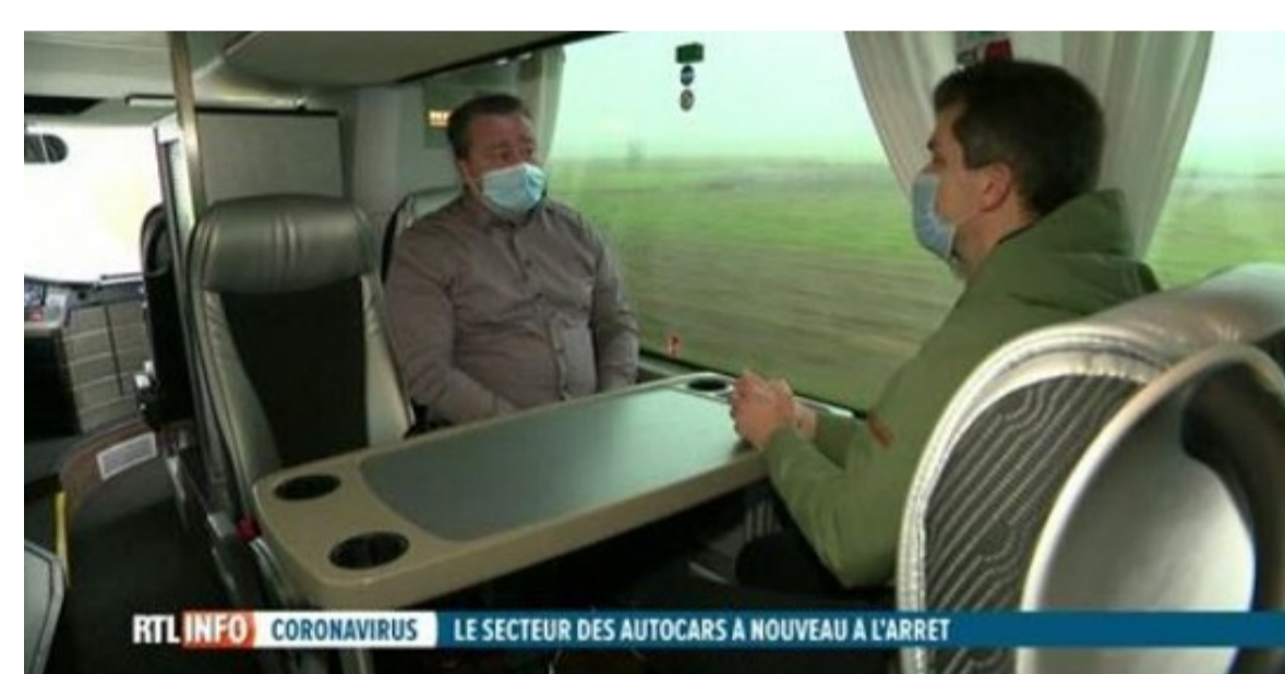
LE SECTEUR DES AUTOCARS A NOUVEAU A L'ARRÊT