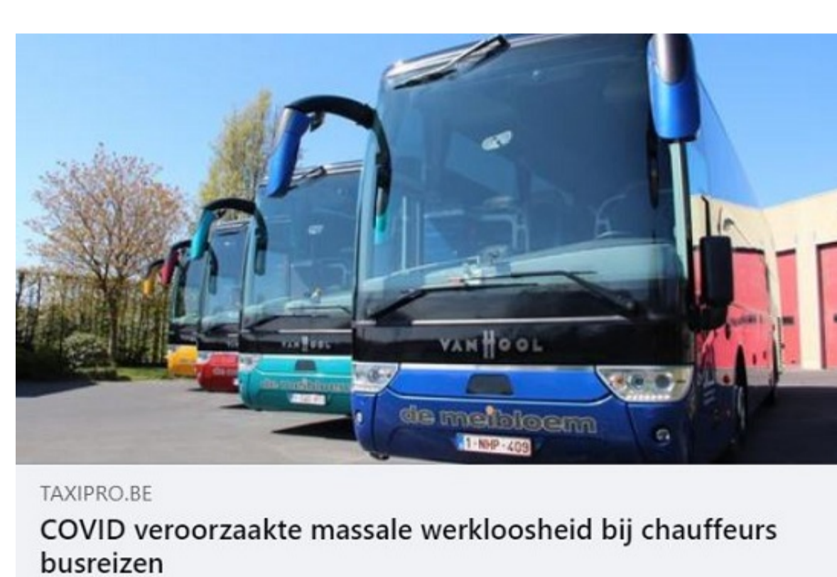
FAVORIS DE COVID veroorzaakte massale werkloosheid bij chauffeurs busreizen

"Massale werkloosheid bij chauffeurs busreizen"