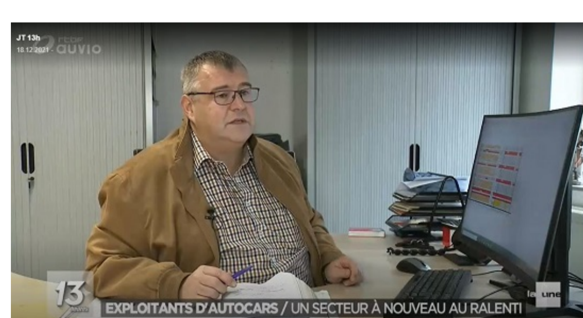
EXPLOITANTS D'AUTOCARS / UN SECTEUR A NOUVEAU AU RALENTI